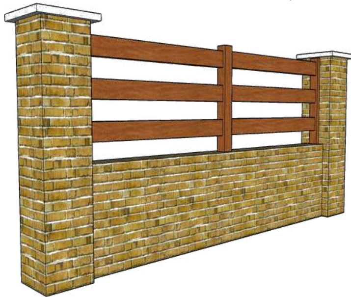
Photo non contractuelle, l'esthétique peut varier en fonction des dimensions de votre projet