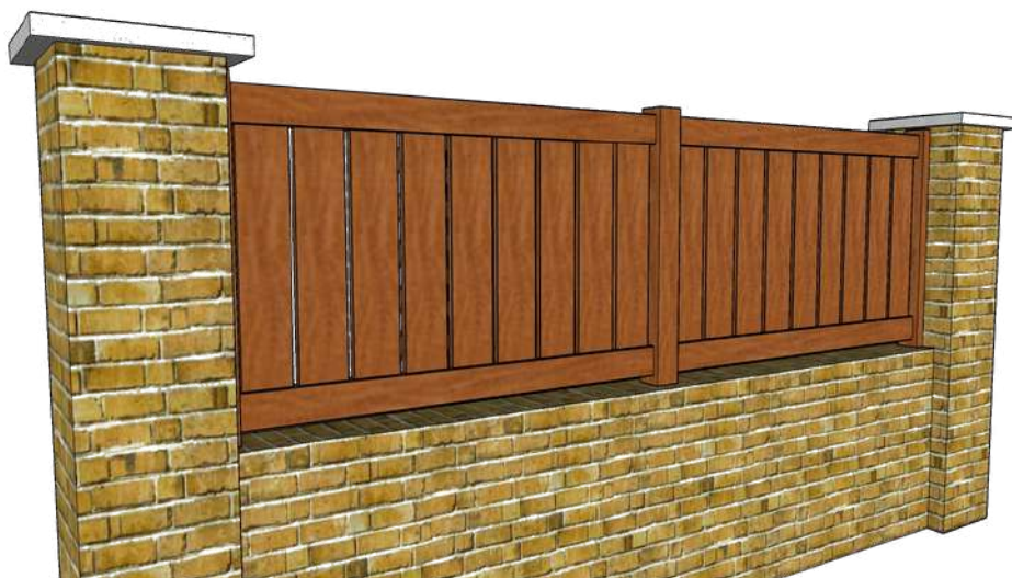
Photo non contractuelle, l'esthétique peut varier en fonction des dimensions de votre projet