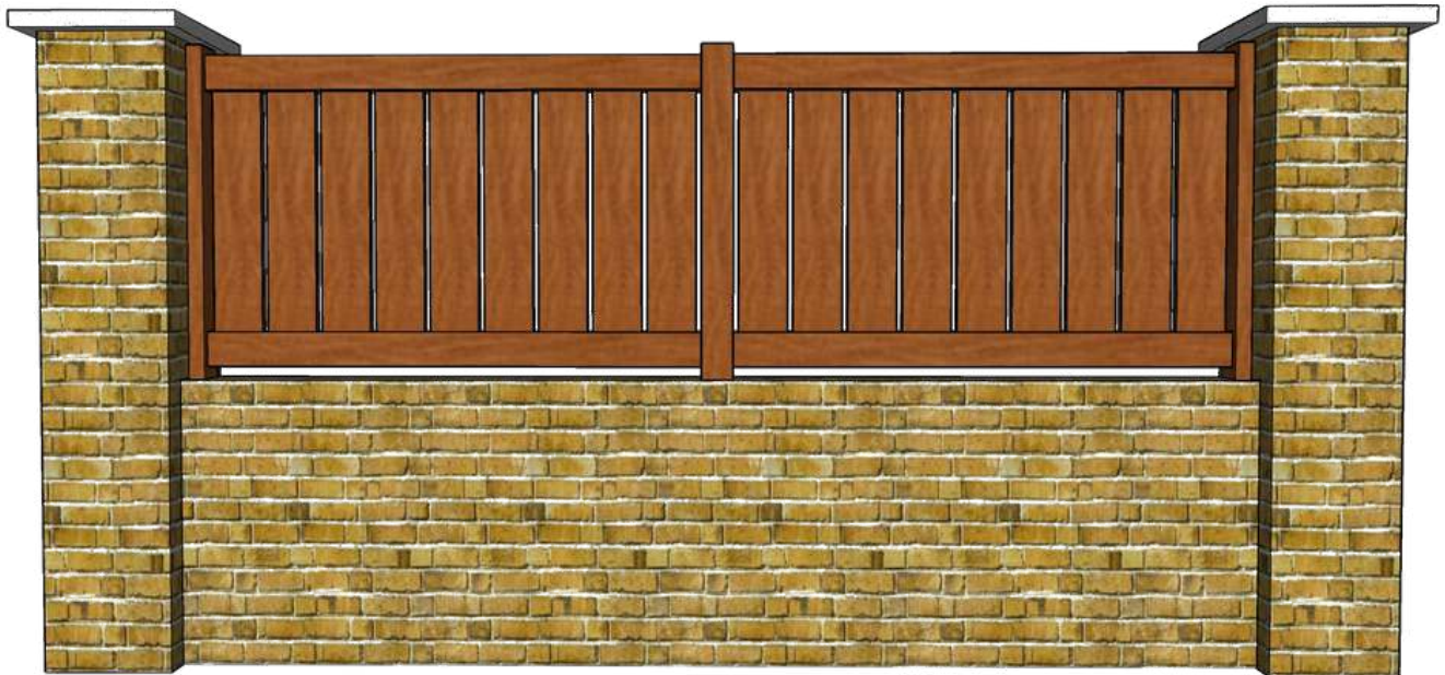
Photo non contractuelle, l'esthétique peut varier en fonction des dimensions de votre projet

Essence disponible : Sipo ou Fraké T.H.T. Bois certifié OLB ou FSC Origine Afrique Classe emploi 3a, 3b