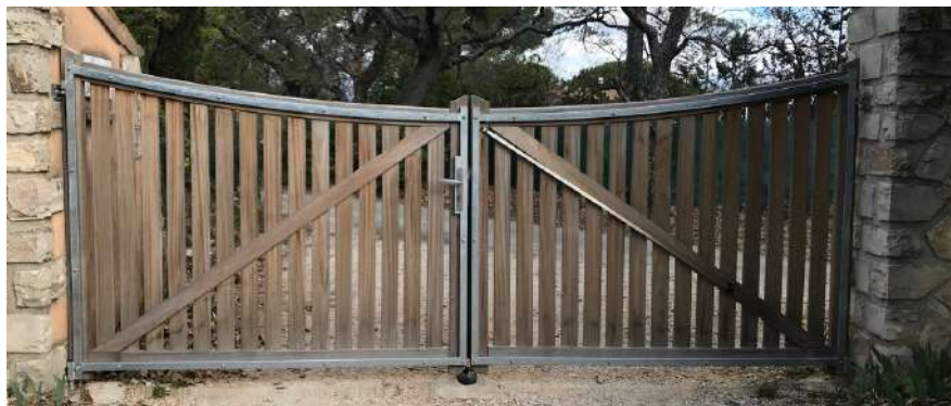
Portail Tavignand en Sipo - vue intérieure - Cintré - Cadre acier