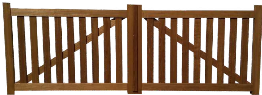
Portail Tavignand en Fraké T.H.T.