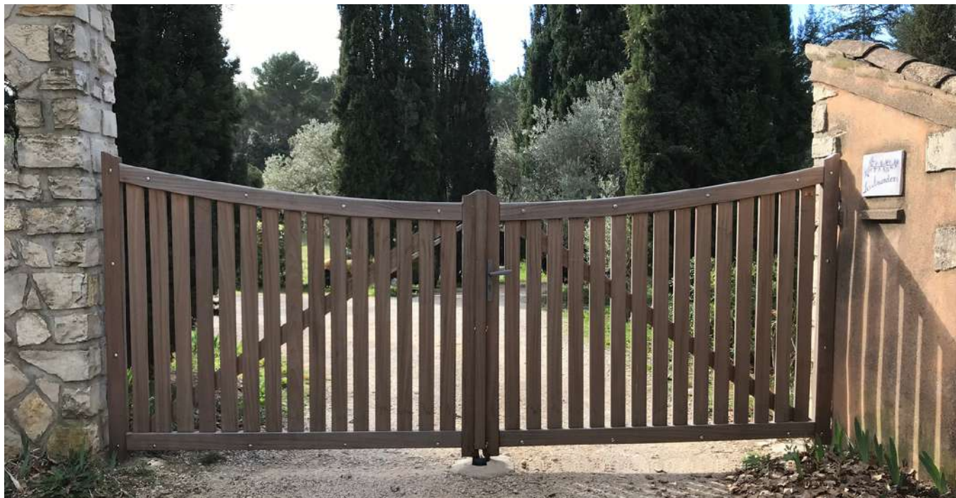
Portail Tavignand en Sipo - Cintré - Cadre acier

PORTAILS ET CLÔTURES EN BOIS PAR JOUEN FRÈRES