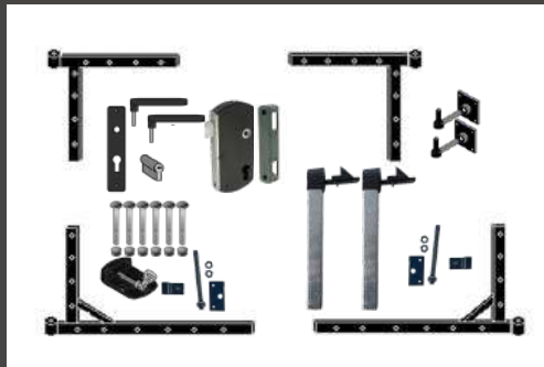
kit ferrage standard