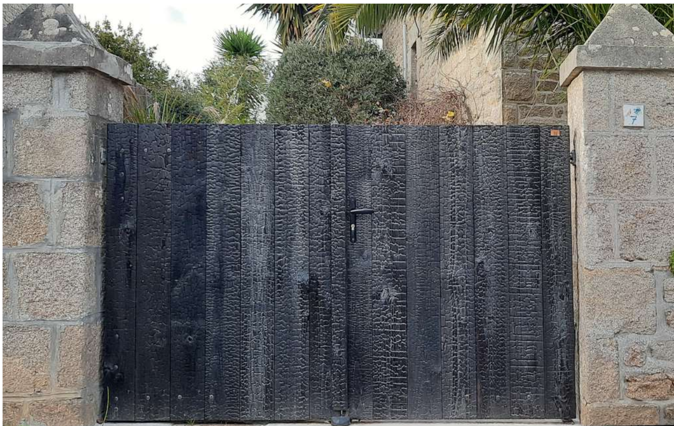
Portail Etna en pin maritime T.H.T. Kerné Paysages (dpt 29)

PORTAILS ET CLÔTURES EN BOIS PAR JOUEN FRÈRES