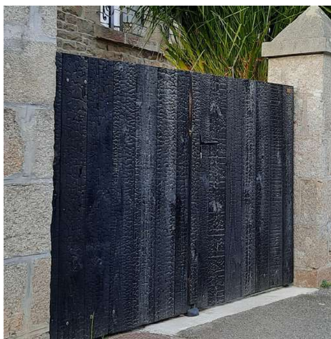
Portail Etna en pin maritime T.H.T. Kerné Paysages (dpt 29)