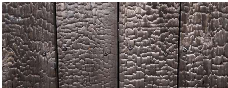
Zoom Bois brûlé