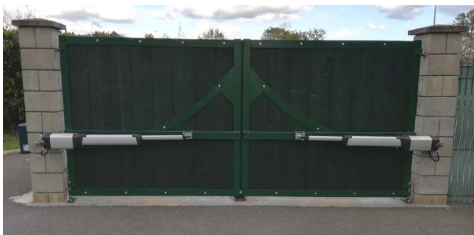
Portail SW204 en épicéa T.H.T. - thermolaquage du cadre acier et finition couleur