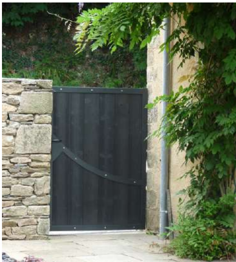
Portillon SW204 en épicéa T.H.T. - thermolaquage du cadre acier et finition couleur