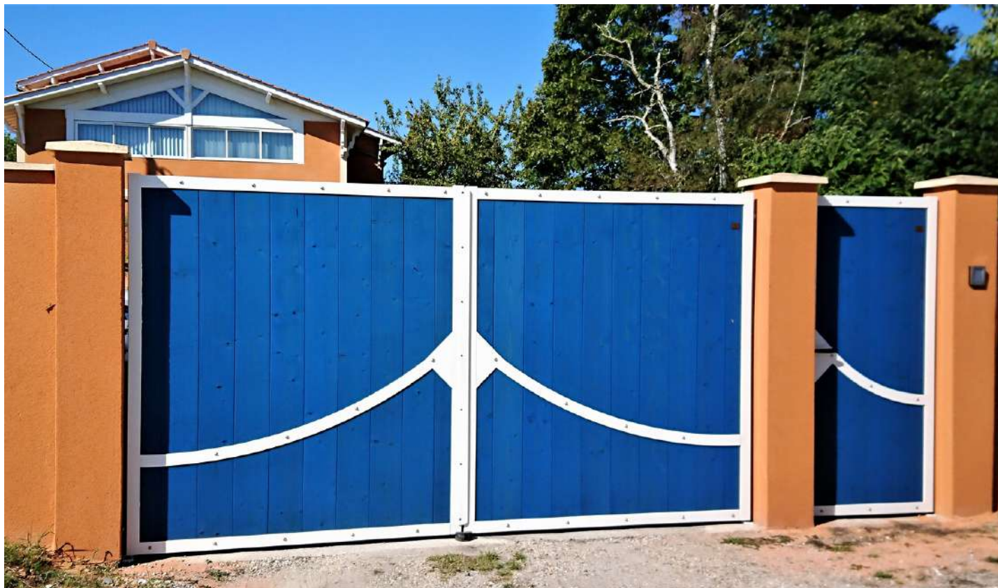
Portail SW204 en épicea T.H.T. - thermolaquage du cadre acier et finition couleur

PORTAILS ET CLÔTURES EN BOIS PAR JOUEN FRÈRES