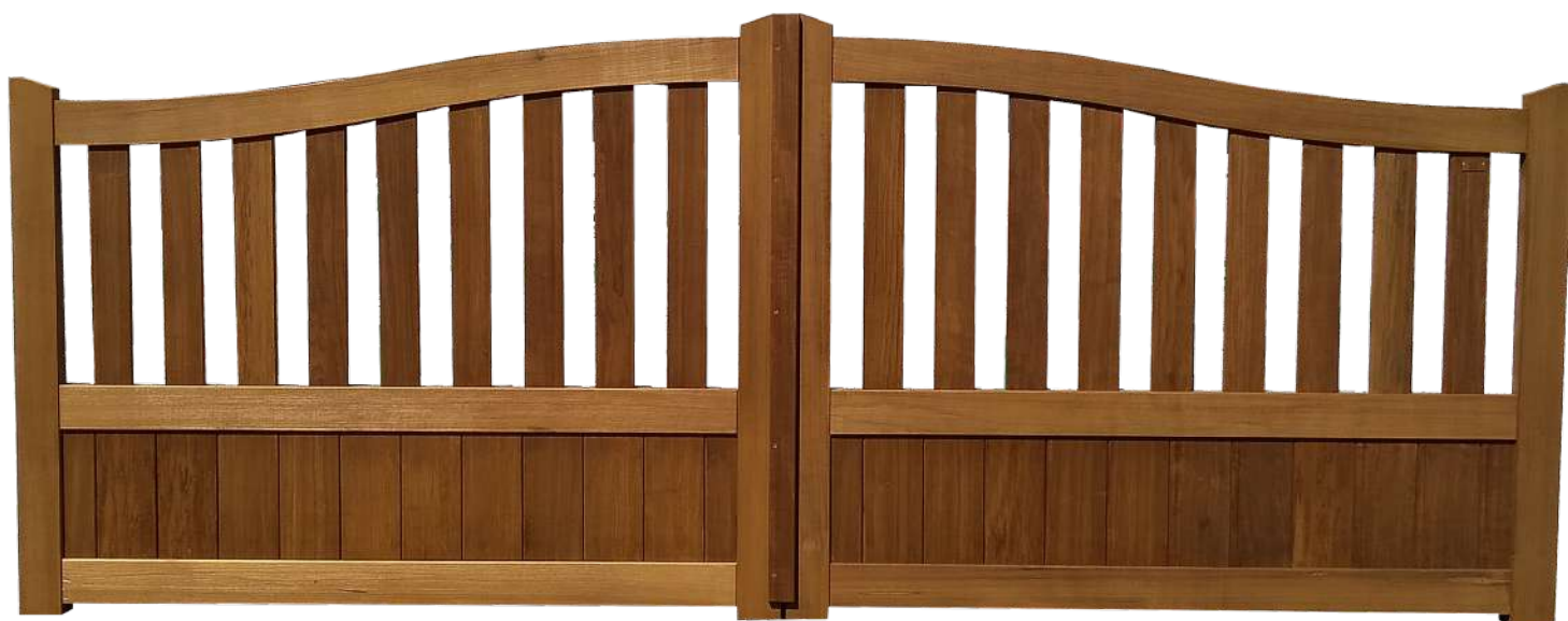
Photo non contractuelle, l'esthétique peut varier en fonction des dimensions de votre projet

PORTAILS ET CLÔTURES EN BOIS PAR JOUEN FRÈRES