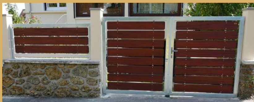
SW210 avec finition saturabois S01 Chocolat Photos non contractuelle

Composez un ensemble avec portillon et clôture du même modèle