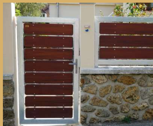
SW210 avec finition saturabois S01 Chocolat Photos non contractuelle